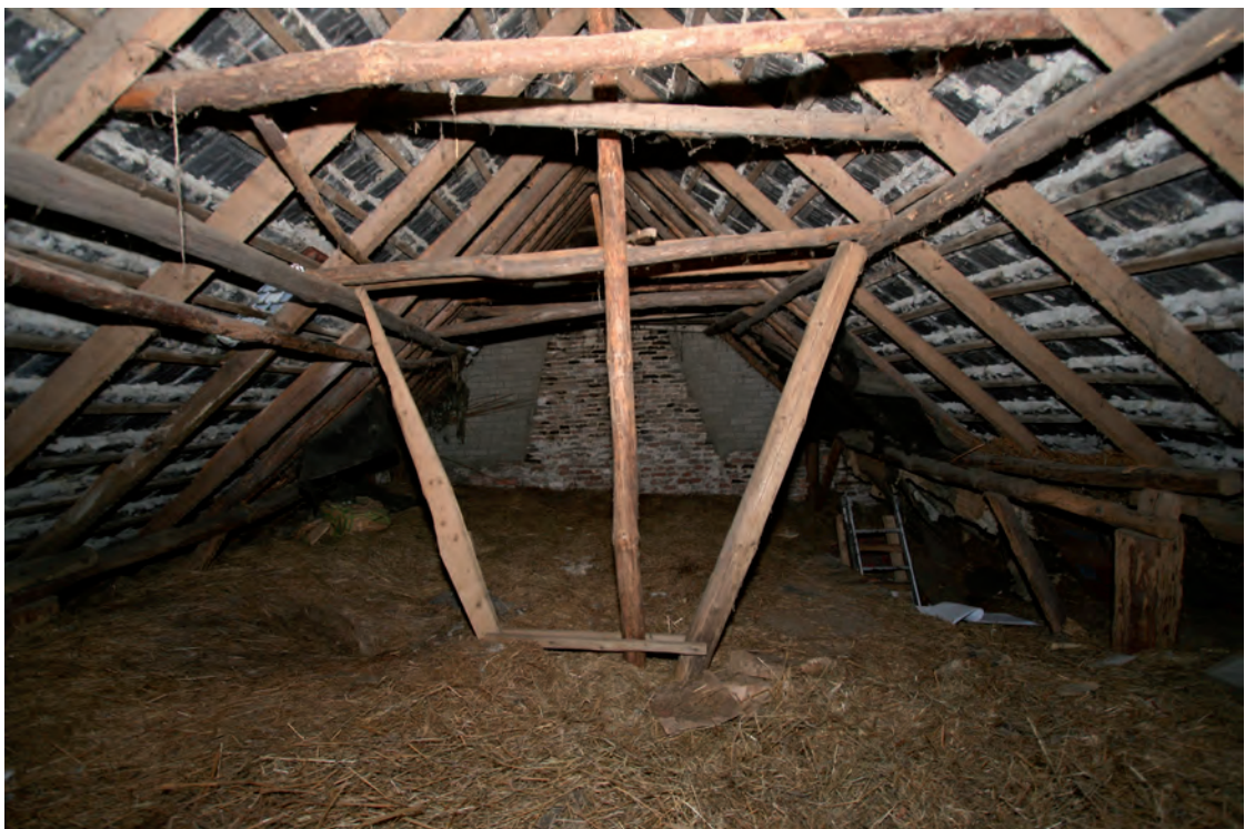
Afb. 31 Overzicht van de kapconstructie gezien in de richting van de brandmuur.