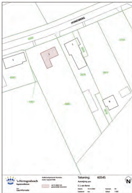
Afb. 35 Een detail van de huidige kadastrale situatie.

In het tweede kwart van de twintigste eeuw blijkt het woondeel van de boerderij wederom te klein. In deze fase wordt het woondeel verlengd waarbij vooral ouder sloopmateriaal in de nieuwe geveldelen wordt toegepast. De huidige gang ontstaat, met als gevolg dat de voordeur, die zich vroeger in de herd bevond, en een vensteropening moeten worden verplaatst. De brandmuur wordt opgehoogd en de keuterij krijgt een nieuwe kap op het woondeel, waar ook een nieuwe zoldervloer wordt aangebracht. Nagenoeg de gehele interieurindeling stamt uit deze periode. Op het perceel komt een vrijstaande stal tot stand.