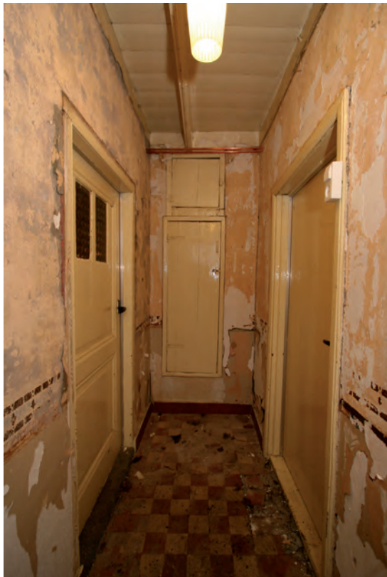
Afb. 16 De gang, gezien vanaf de voordeur. Links het vertrek met de schouw, rechts de uitbreiding van het woondeel. Aan het einde van de gang twee kastdeurtjes.

De interieurindeling van de keuterij bestaat uit een smalle gang over bijna de gehele diepte van het woondeel. Aan het einde bevindt zich een kastruimte. Rechts van de gang bevindt zich het grootste vertrek, de huidige slaapkamer. Links van de gang bevinden zich de herd met daarnaast de huidige keuken en de opkamer/kelder. De gangmuren en de muur die de herd van de huidige keuken en de opkamer scheidt, zijn geen van alle in verband met de voor- en achtergevel gemetseld. Dit duidt er op dat de dwarsmuren niet uit de eerste fase dateren. Dat dit voor de gangmuren van toepassing is, was al duidelijk. De gang is immers pas na de verlenging van het woongedeelte tot stand gekomen en in de rechter gangmuur zijn zelfs betonstenen toegepast. Dat de muur tussen de herd en de keuken en opkamer niet in verband met de gevels is gemetseld, is opvallend te noemen. Het is mogelijk dat deze muur op ongeveer veertig tot vijftig centimeter van een oudere muur in de richting van de herd is verplaatst. Hierbij is de boezembalk ingekort. De muur dateert van de verlenging van het woondeel, vermoedelijk in het tweede kwart van de twintigste eeuw. Dit is vast komen te staan vanwege het gebruikte materiaal; hergebruikte laat negentiende-eeuwse bakstenen in combinatie met twintigste-eeuwse betonstenen.