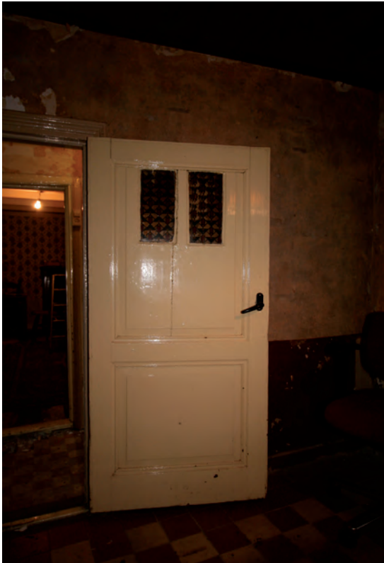
Afb. 19 De negentiende-eeuwse, vermaakte paneeldeur in de linker gangmuur.