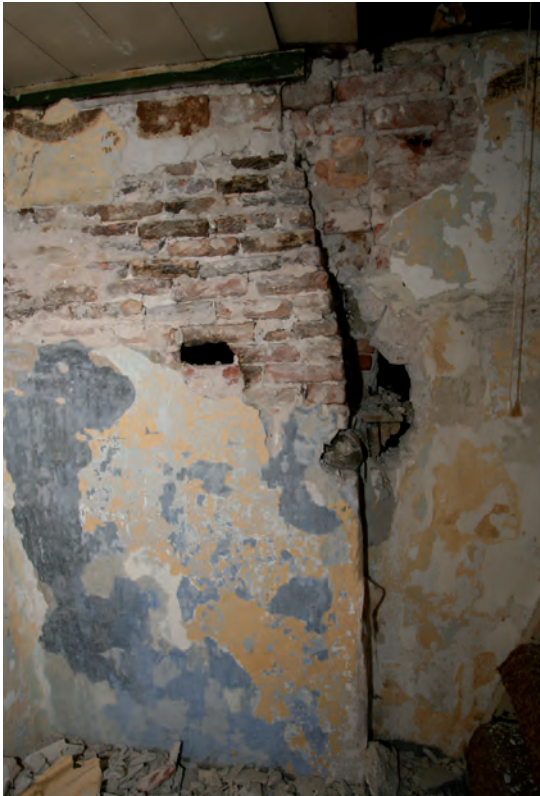
Afb. 22 De aansluiting van de binnenmuur op de oudere schouw.