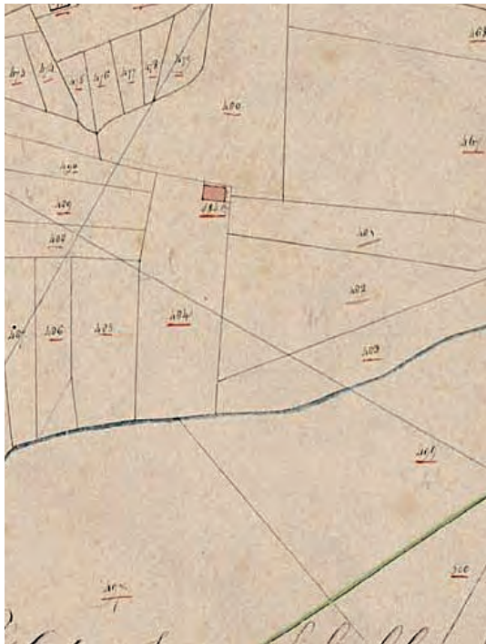
Afb. 33 Een detail van de kadastrale kaart van 1832.

Een leuk detail is dat de positie van de drie wilgen de oorspronkelijke breedte van de keuterij markeert.