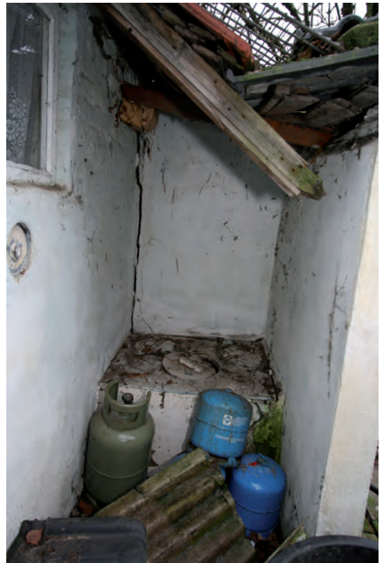
Afb. 15 Een blik in de buitentoilet geplaatst tegen de zuidoostgevel van het staldeel. Het muurwerk is niet in verband gemetseld met deze gevel.