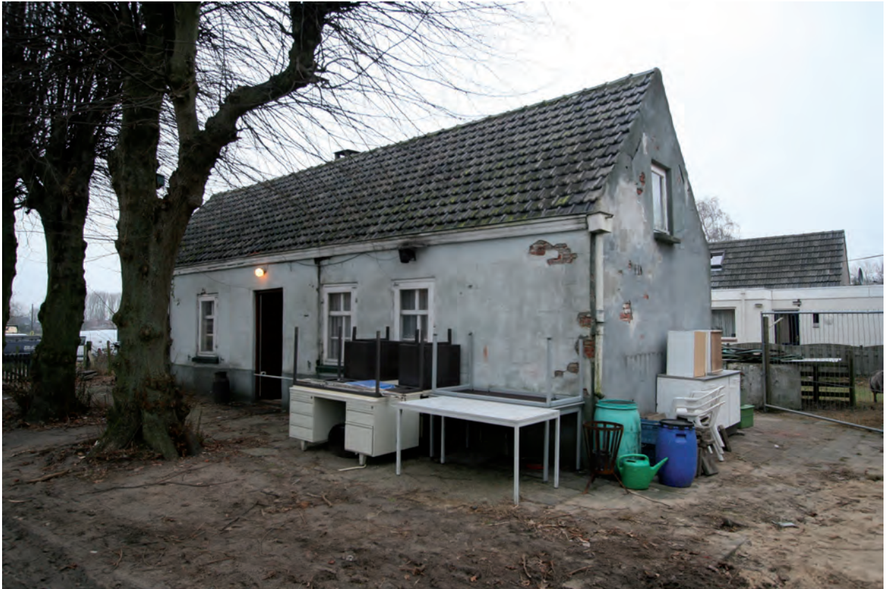
Afb. 2 Een overzicht van de voorgevel met daarvoor drie snoeilinden. De keuterij gezien vanuit het zuidwesten.