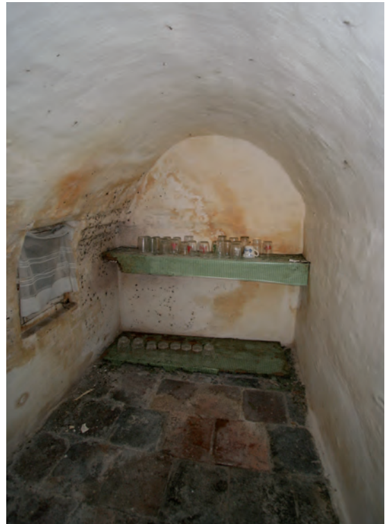
Afb. 27 De kelder van de keuterij.