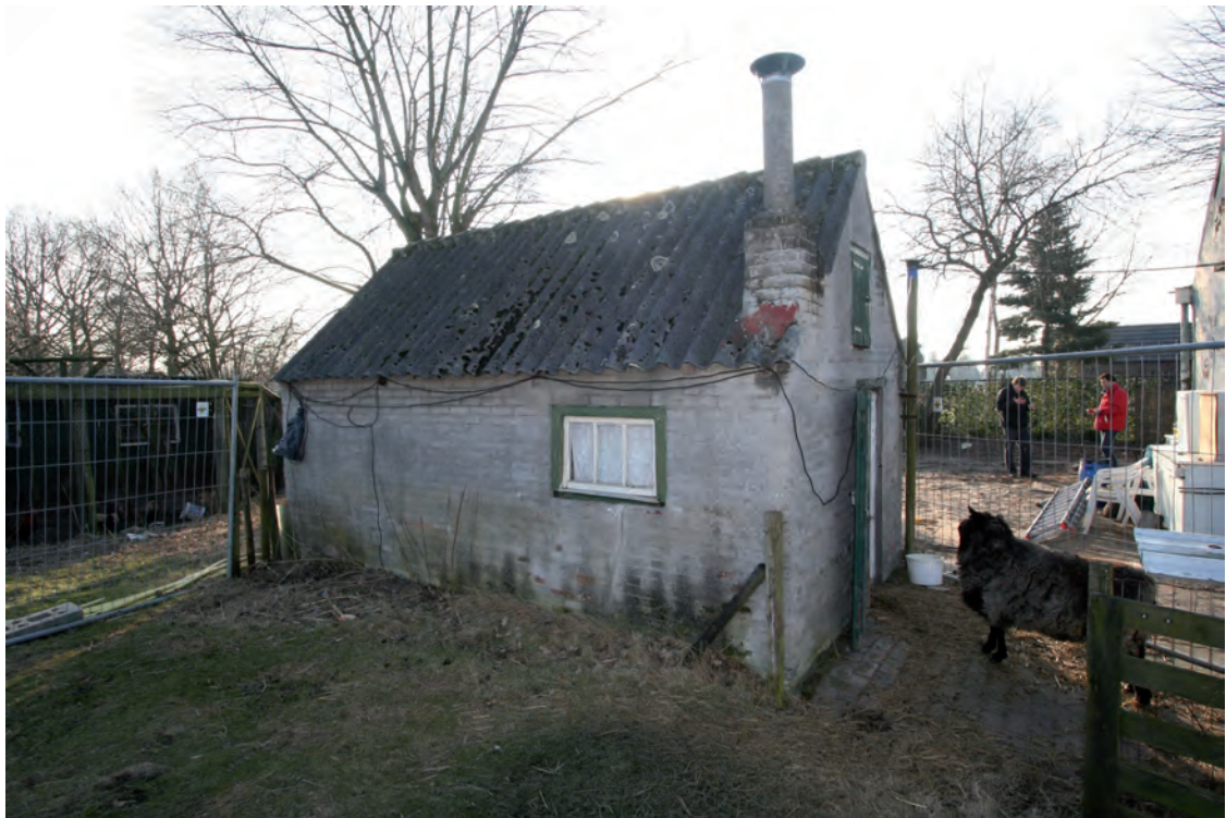
Afb. 32 De vrijstaande stal gezien vanuit het noordoosten.

Het kleine éénlaags bouwsel, opgetrokken in bak- en betonsteen, heeft een zadeldak dat gedekt is met golfplaten. Het op de keuterij gerichte topgeveltje van de rechthoekige stal heeft een houten deur onder een latei en op de zolder een hooiluik. Links heeft de gevel een schoorsteen. De rechterzijgevel is voor het grootste deel opgetrokken in baksteen, en wel in een halfsteens verband. De bovenste decimeters van de gevel zijn in betonsteen gemetseld, een materiaal dat vanaf de jaren 1930 veelvuldig werd toegepast. De achtergevel waarin zich een vierruits raam, naar wat lijkt het gekantelde onderraam van een oud schuifvenster, bevindt, is grotendeels in betonsteen opgetrokken. Het onderste deel is uitgevoerd in baksteen. De houten latei boven het venster is afgaande op een aanwezige toognagel, een restant van een negentiende-eeuws kozijn. De linkerzijgevel heeft een vermoedelijk hergebruikt twintigste-eeuws venster bestaande uit een drieruits raam dat is gevat in een ongeprofileerd kozijn. Het stalletje heeft een ongedeelde begane grond en een zoldervloer op vier balken, inclusief twee strijkbalken.