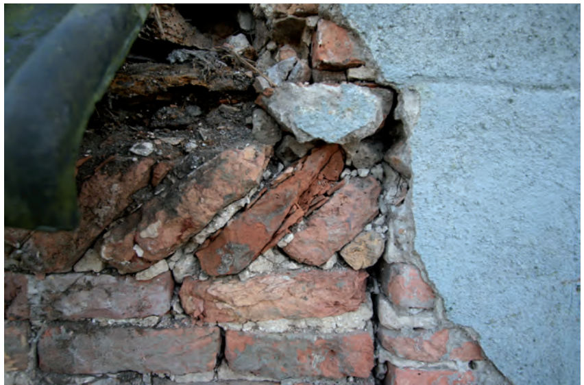
Afb. 11 Een detail van de aansluiting van de opvulling van de zijgevel van de stal op de bepleisterde zijgevel van het woondeel.