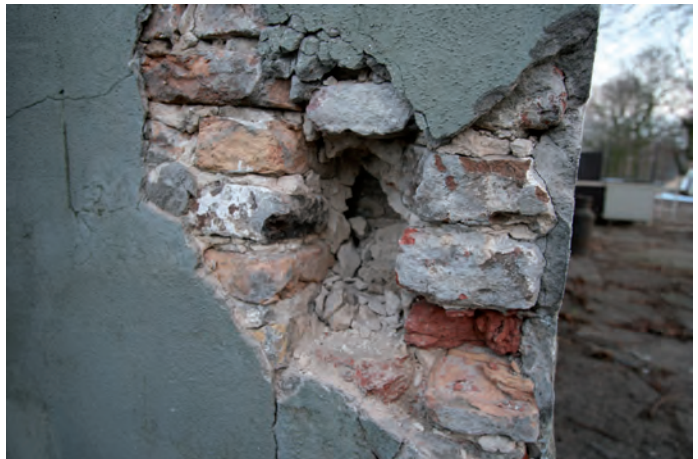
Afb. 4 De inkassing van de voorgevel in de oudere zijgevel links op de foto.