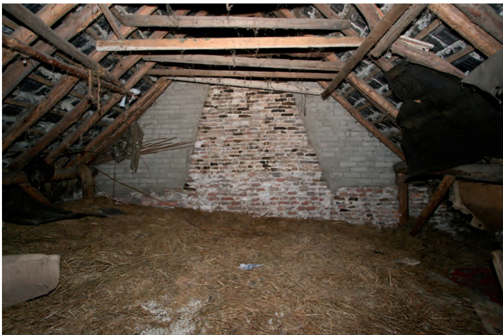
Afb. 28 De brandmuur gezien vanuit de stal. De latere opvulling van de ruimte aan weerszijden van het rookkanaal tekent zich overduidelijk af.

De brandmuur tussen het woondeel en de stal is met hergebruikte bakstenen gemetseld. De meeste stenen vertonen sporen van roetdoorslag. Het oudste werk bevindt zich direct achter de schouw en het rookkanaal. Op de begane grond is het muurwerk dat hierop aansluit jonger. Oorspronkelijk was de hooizolder boven de stal vanuit de zolder van het woondeel toegankelijk. Op zolderniveau stond het rookkanaal vrij in de ruimte. De openingen zijn in het tweede kwart van de twintigste eeuw dichtgemetseld. Een van de gebinten van de boerderij is opgenomen in de brandmuur.