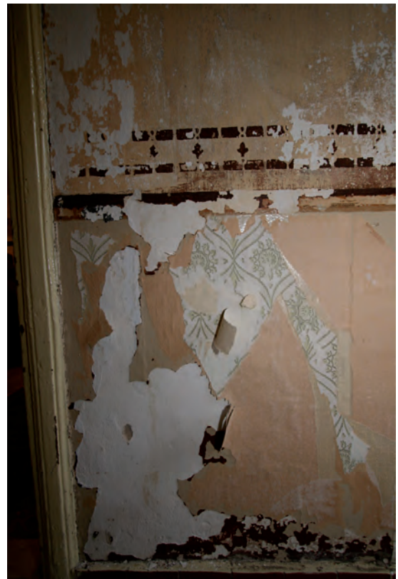
Afb. 17 Een detail van de eenvoudige lambriseringslijst waar een rode sjabloonschildering op is aangebracht. Deze schildering is vermoedelijk uit het tweede kwart van de twintigste eeuw.