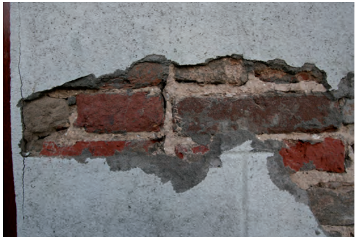
Afb. 3 Een detail van de bouwnaad rechts naast de voordeur.