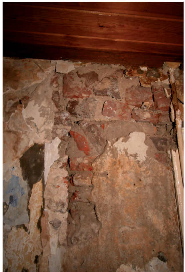
Afb. 8 In het interieur is de dichtzetting van de voormalige opening voor de deur in de voorgevel goed zichtbaar.