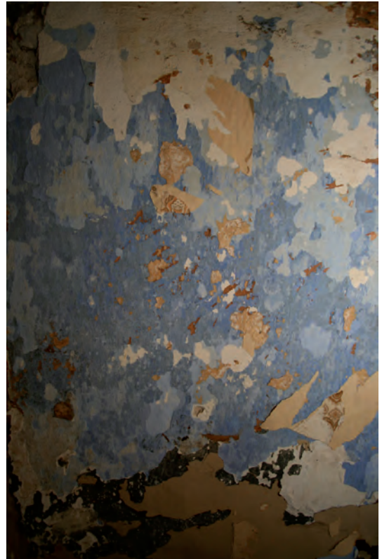
Afb. 20 De typische negentiende-eeuwse muurafwerking met helblauwe pleister. Dit is één van de oudste afwerkklagen in het interieur.