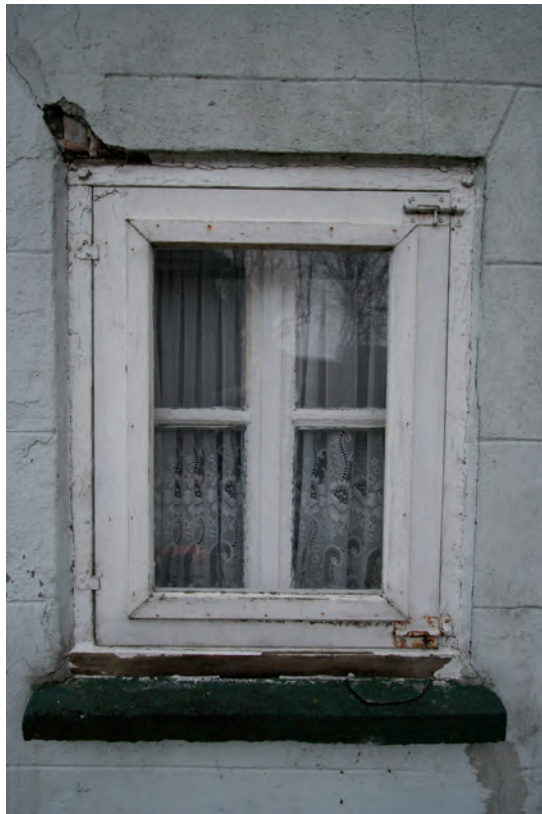
Afb. 5 Een foto van het kleine venster (met een voorzetraam) uiterst links in de voorgevel. Let op de schijnvoeg die de suggestie wekt dat er achter de pleisterlaag een strekse boog schuil gaat.

De haaks op de straat gerichte voorgevel van de keuterij is een bepleisterde gevel met schijnvoegen die wordt afgedekt door een sober uitgevoerde bakgoot. De gevel heeft een moderne voordeur met aan weerszijden twee negentiende-eeuwse vensters. Het venster uiterst links in de gevel, het enige stolpvenster, is kleiner dan