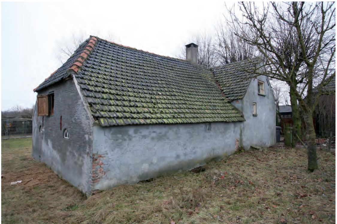
Afb. 13 Een overhoekse foto met daarop de kopgevel van het staldeel en de kopgevel van het woondeel (rechts). Het staldeel is haaks op het woondeel georiënteerd.

De gepleisterde achtergevel van het staldeel heeft een symmetrische indeling op de begane grond, twee halfronde ijzeren stalvensters met een gevorkte tracering en op de zolder een hooiluik. De beide gevelankers markeren de plaats waar de vlieringen aansluiten op het muurwerk. Op maaiveldniveau zijn twee kippenopeningen aanwezig. Op basis van het baksel wordt vermoed dat het exterieur van het staldeel rond 1900 is vernieuwd.