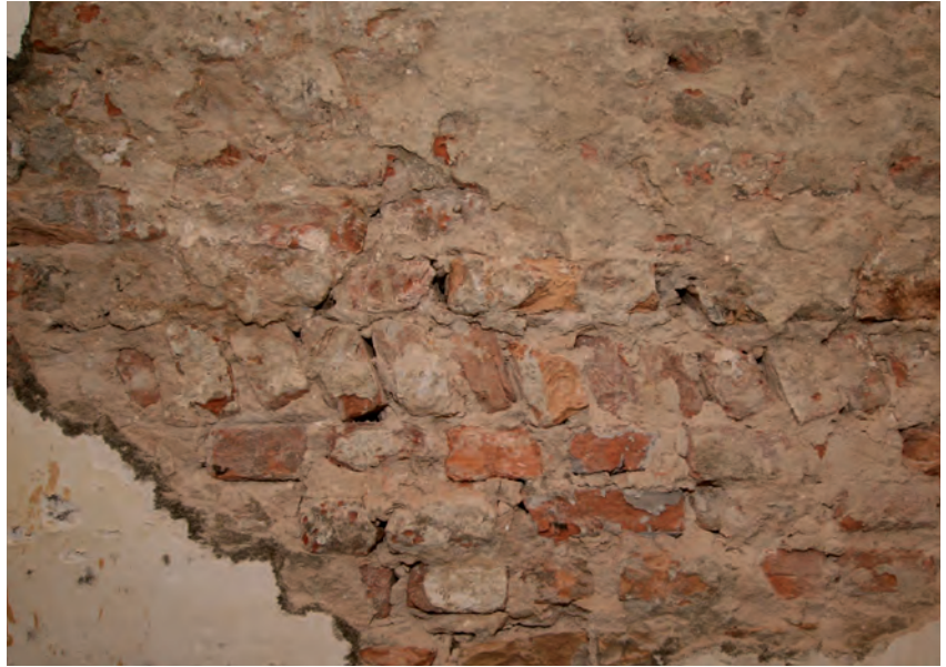
Afb. 10 Een detail van de linker zijgevel waarin zich duidelijk de verhoging van het metselwerk aftekent.