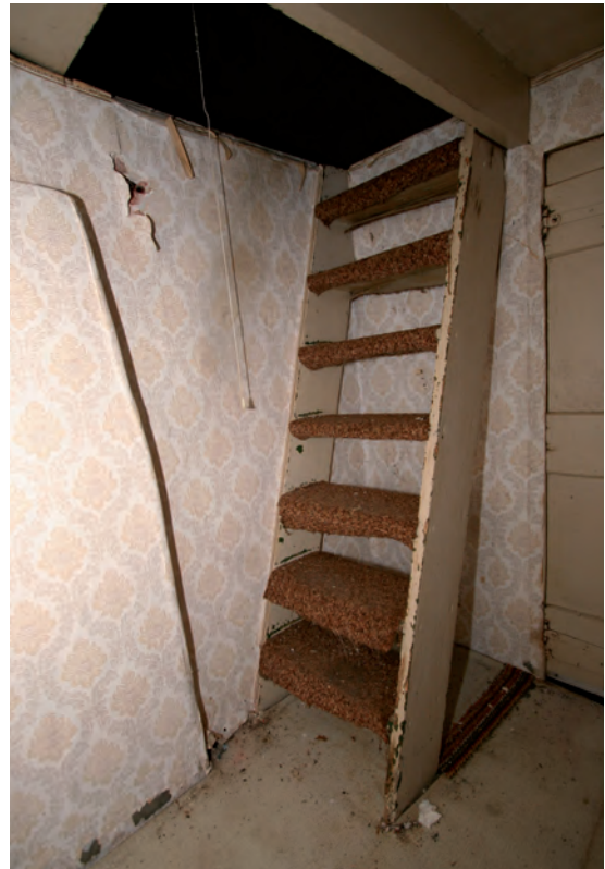
Afb. 25 In de opkamer bevindt zich de eenvoudige, bijzonder steile steektrap naar de zolder.