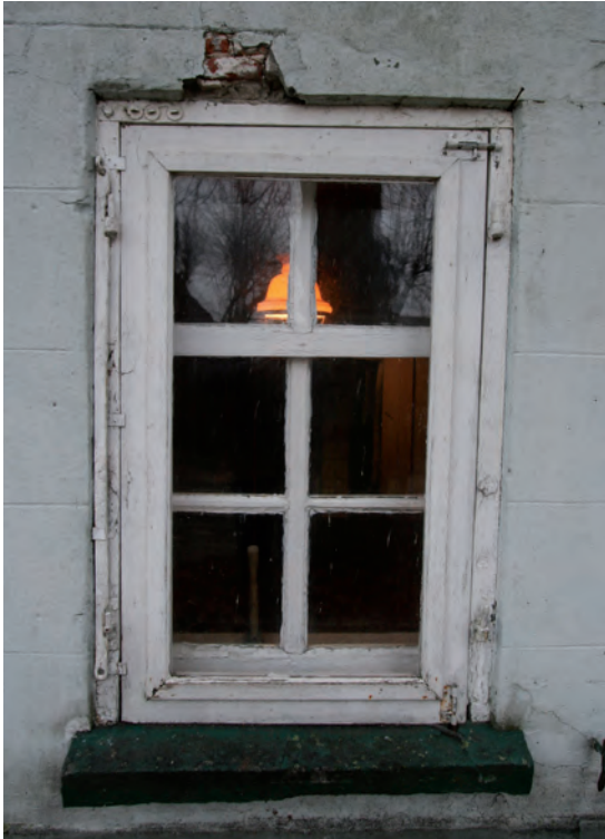
Afb. 6 Een foto van één van de drie grotere schuifvensters in de voorgevel. Dit exemplaar bevindt zich links van de deur.