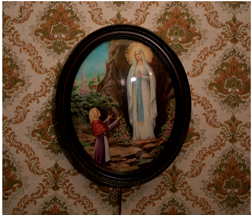
Afb. 18 Typerend voor het leven in een keuterij, een mariabeeltenis aan de behangen binnenmuur.

Het vertrek rechts van de gang laat zich het meest eenvoudig beschrijven. Het rechthoekige vertrek heeft tapijt op de houten vloer, behangen muren waartegen een latere, vrij recente lambrisering is aangebracht. De enkelvoudige balklaag van de zoldervloer is in het zicht. De deur naar de gang is een opgedekte deur, doch aan de gangzijde is de profilering verwijderd. De deur is gevat in een geprofileerd binnendeurkozijn. Het hangwerk is vroeg twintigste-eeuws en in het pand meermaals toegepast. De klink is van bakeliet.