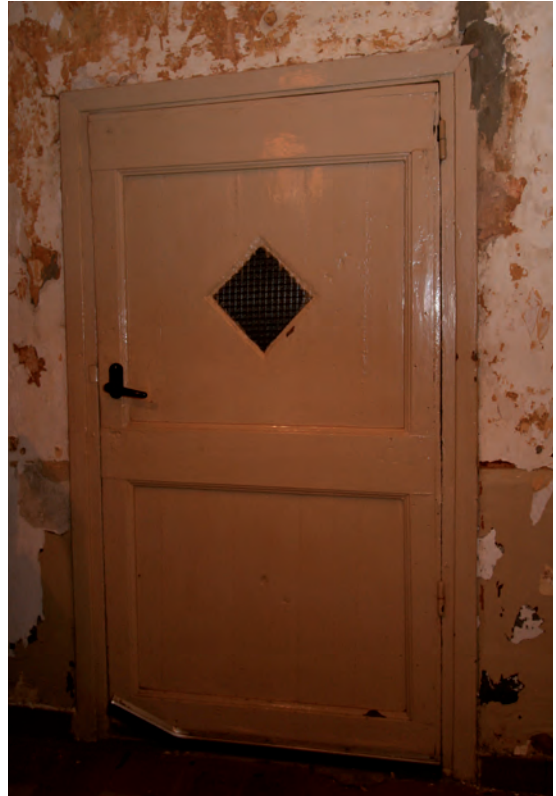
Afb. 23 De (vermaakte) paneeldeur naar de keuken. Een aardig detail is het ruitvormige raam met daarin sierglas.