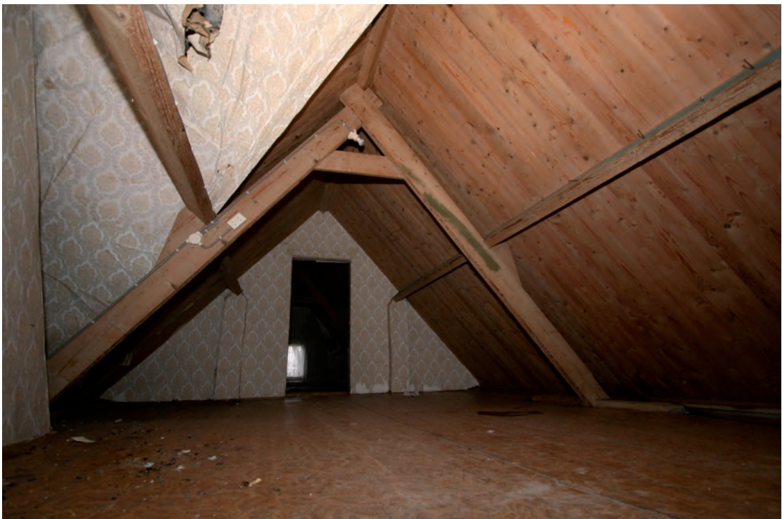
Afb. 26 De zolder gezien vanaf de steektrap in zuidelijke richting.

De geheel behangen keuken heeft een kelderluik met daarop twee treden die leiden naar de opkamer. Aan weerszijden bevinden zich twee later aangebrachte kasten. De deur naar de opkamer is gevat in een eenvoudig kozijn. Het vertrek heeft een houten vloer en als plafond een enkelvoudige balklaag van de zoldervloer. Het kelderluik heeft dezelfde scharnieren als de deur tussen de gang en de herd, de opkamerdeur en de deur van de voorstal.