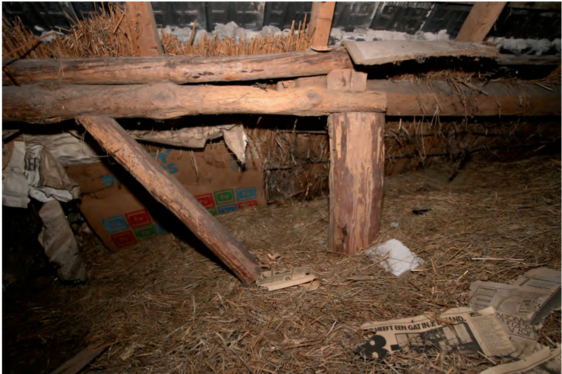
Afb. 30 Een detail van de oudste draagconstructie. Op de foto het deel van de gebintstijl dat boven de zoldervloer uitsteekt en waarover de eenzijdig met een windverband geschoorde vliering is gelegd.