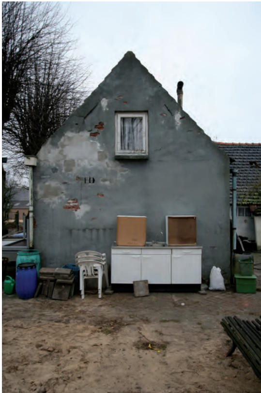
Afb. 14 De op het zuiden gerichte kopgevel van het woondeel van de keuterij.

De bepleisterde rechterzijgevel van het woondeel is symmetrisch van opzet. De gevel is blind op de begane grond en heeft op de zolder een twintigste-eeuws venster met een ongedeeld draaiend raam. Dit venster is recenter en groter dan het venster in de linkerzijgevel (de straatgevel). Ook hier bevinden zich ter hoogte van de bovendorpel van het venster twee gordingankers waarvan de schieter de lijn van de geveltop volgt. In de top bevindt zich een nokanker. Op enkele plekken is de pleister van de gevel afgevallen waardoor de hergebruikte bakstenen met de opvallend grote formaten zichtbaar zijn. De steensdikke muur heeft een halfsteens beklamping gekregen. De bepleisterde rechterzijgevel van het staldeel is met rode steen gemetseld en heeft van links naar rechts de opgeklampte deur naar de voorstal, een horizontaal driedelig venster, een later aangebouwd buitenprivaat en een tweeruits venster. Onder dit tweeruits venster dat vermoedelijk stamt uit het tweede kwart van de twintigste eeuw bevindt zich een dichtgezette varkensopening. Dit deel van de gevel is vermoedelijk rond 1900 vernieuwd.