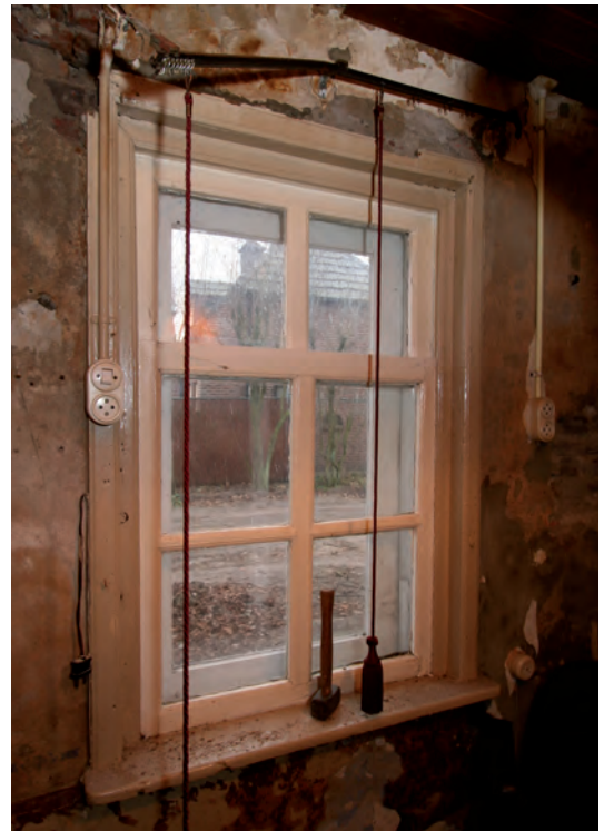
Afb. 7 Een foto van hetzelfde venster, nu vanuit het interieur. Duidelijk zichtbaar dat het onderraam schuivend is.