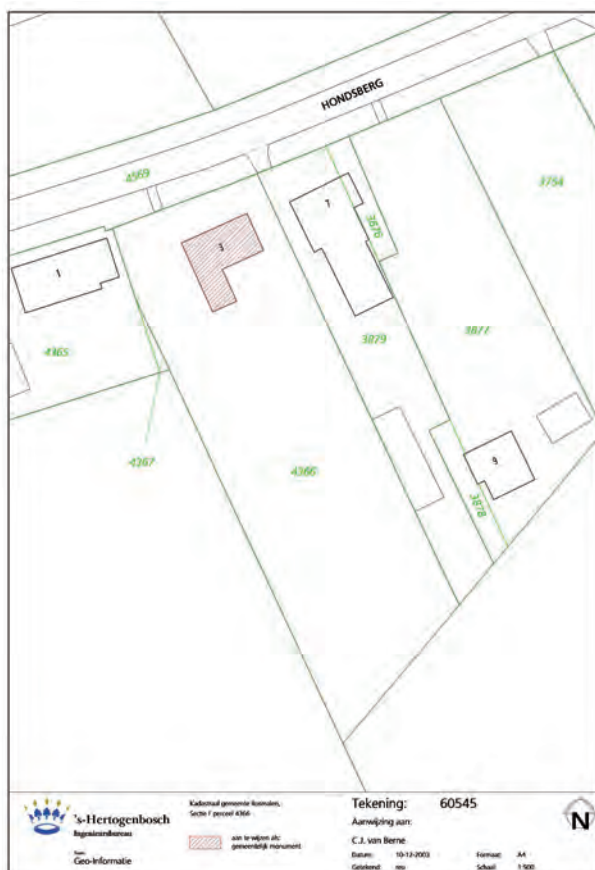
Afb. 1 De kadastrale kaart die de bestaande situatie in 2005 weergeeft.

De keuterij heeft een L-vormige plattegrond. Het woondeel staat haaks op de straat en omvat een begane grond en een zolder onder een met gesmoorde kruispannen gedekt zadeldak. Haaks op het woondeel sluit het staldeel aan. Beide delen worden van elkaar gescheiden door een zogenaamde brandmuur. Het staldeel heeft eveneens een met kruispannen gedekt zadeldak, dat aan de achterzijde afgewolfd is. Op het erf bevindt zich verder een kleine in betonstenen opgetrokken stal, een gemetselde waterput en een in afvalhout opgetrokken kippenren. Evenwijdig aan de voorgevel, dwars op de straat, staan drie wilgen.