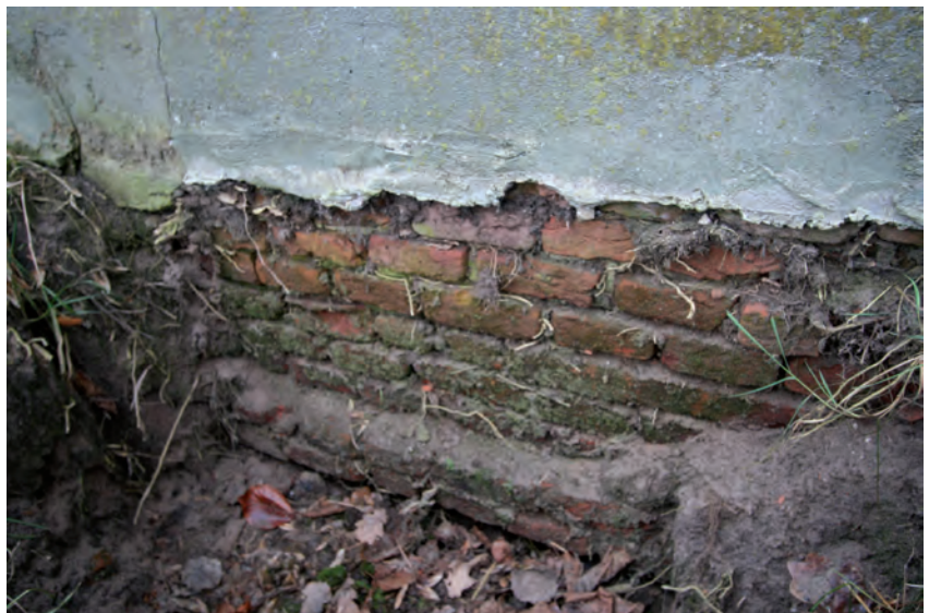
Afb. 12 De vrij gelegde funderingsvoet van het staldeel. Het maaiveldniveau is vermoedelijk omhoog gekomen.