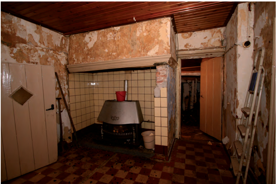
Afb. 21 Zicht op de schouw, met rechts daarvan de deur naar de stal. Links op de foto de binnendeur naar de keuken.