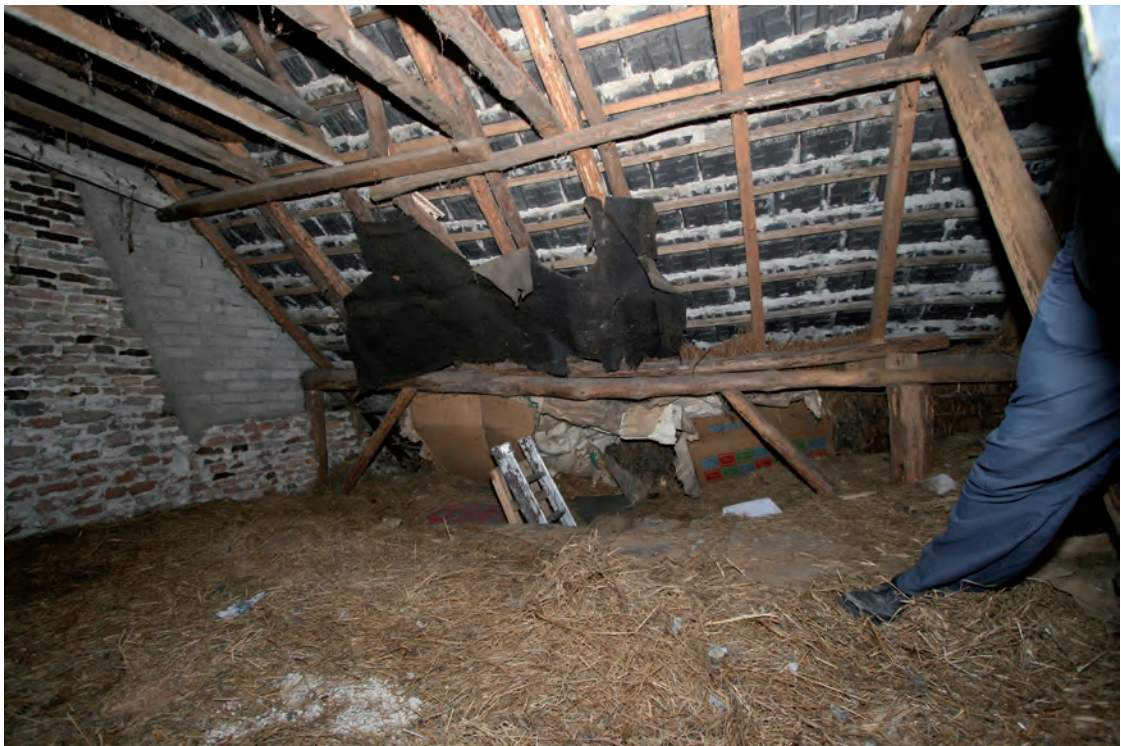
Afb. 29 Het deel van de oudste draagconstructie dat boven de zoldervloer komt. Links op de foto een deel van de brandmuur.

De kap heeft rondhouten sporen, aangevuld met gezaagd hout.