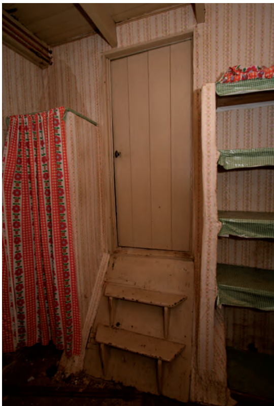
Afb. 24 De trap naar de opkamer, gemonteerd op het luik dat de kelder ontsluit.