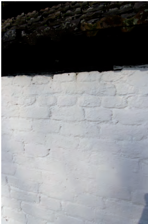
Afbeelding 07: Een detail van de rechter zijgevel van het staldeel. De bovenste drie baksteenlagen zijn later aangebracht. Er is hier sprake van een ophoging van de gevel. Dit komt ook voor in de voorgevel en de linker zijgevel.