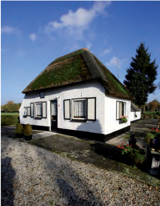
Afbeelding 01: De voorgevel van de boerderij. Overzichtsfoto met duidelijk onder het tweede raamluik een bouwnaad.