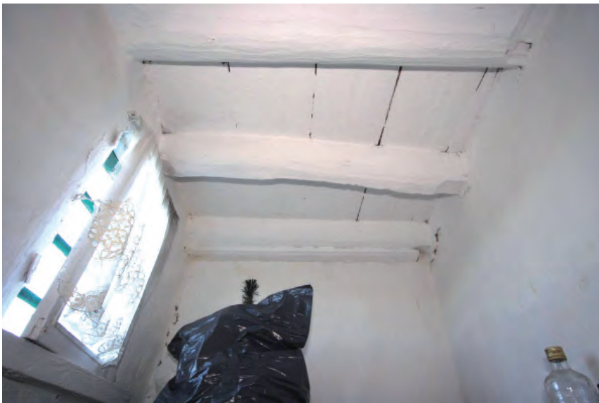
Afbeelding 14: De constructie in de kelder. Hierop is de broodoven geplaatst.