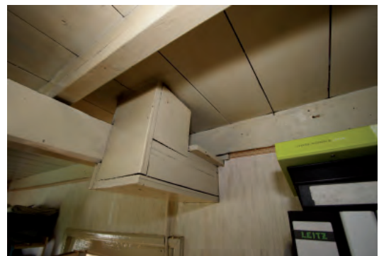
Afbeelding 17: In de slaapkamer is te zien dat de ankerbalk doorsteekt. Het onderste deel van de stijl is hier dus verplaatst.