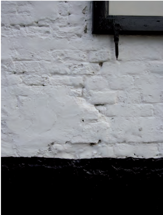
Afbeelding 03: In detail de bouwnaad met links handgevormde IJsselsteentjes uit het tweede kwart van de negentiende eeuw en rechts de machinaal geproduceerde twintigste-eeuwse stenen van de uitbreiding.