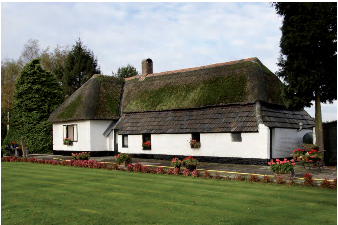
Afbeelding 02: De rechter zijgevel van de boerderij met daarin wel enkele negentiende- of zelfs nog achttiende-eeuwse vensters, maar geen enkele op de oorspronkelijke plaats. De deur is eveneens een latere toevoeging. De grote variatie aan venstergrootte wijst nog eens te meer op het pragmatische hergebruik van materialen (dit was relatief goedkoop) dat zo kenmerkend is voor het (Brabantse) agrarische bouwen.