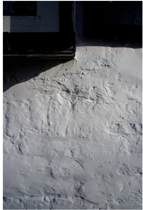
Afbeelding 08: Een detail van een deel van een negentiende-eeuwse rollaag, vermoedelijk horende bij een verdwenen, negentiende-eeuwse gevelopening. De rollaag bevindt zich onder de huidige, jaren zeventig vensters.