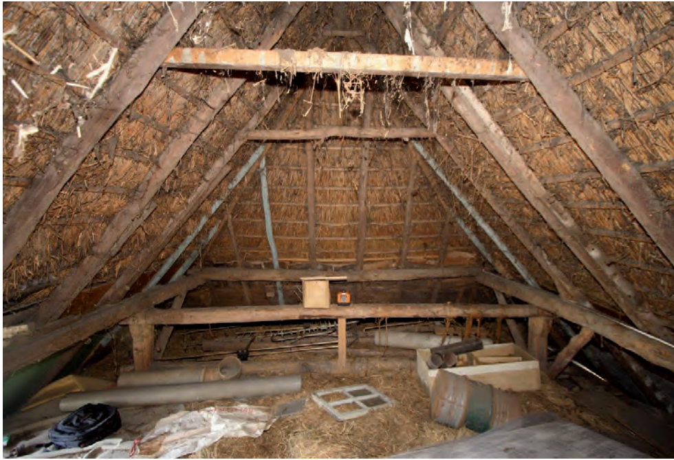
Afbeelding 15: De zolder boven de stal met het bovenste deel van het achterste ankerbalkgebint.