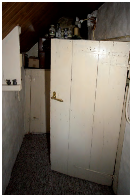
Afbeelding 12: De linker zijbeuk gezien in de richting van het kelderluik. De negentiende-eeuwse deur hoort, op basis van de gehengen, niet bij het deurkozijn.