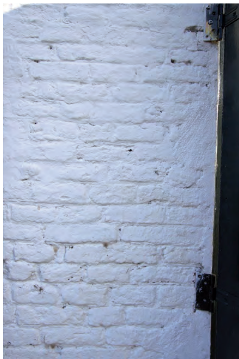
Afbeelding 09: Achter de vernieuwde luiken is het negentiende-eeuwse metselwerk beter te zien. Rechts de latere linker dagkant van een van de vensters.