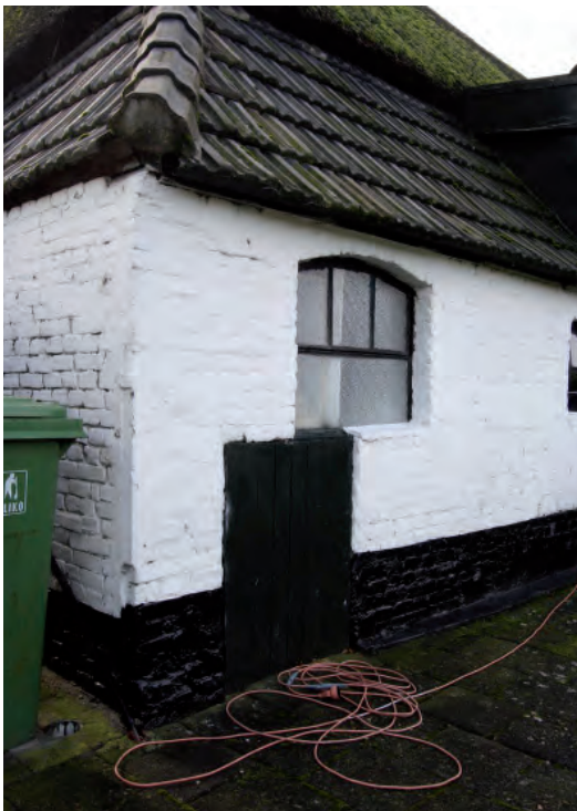
Afbeelding 05: De hoek van de vernieuwde achtergevel en de vernieuwde linker zijgevel. In de linker zijgevel een oorspronkelijk varkensluik en twee later aangebrachte stalvensters.