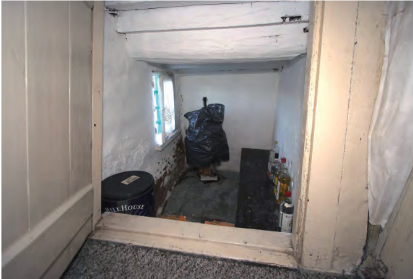
Afbeelding 13: Een blik in de minuscule kelder van de boerderij.