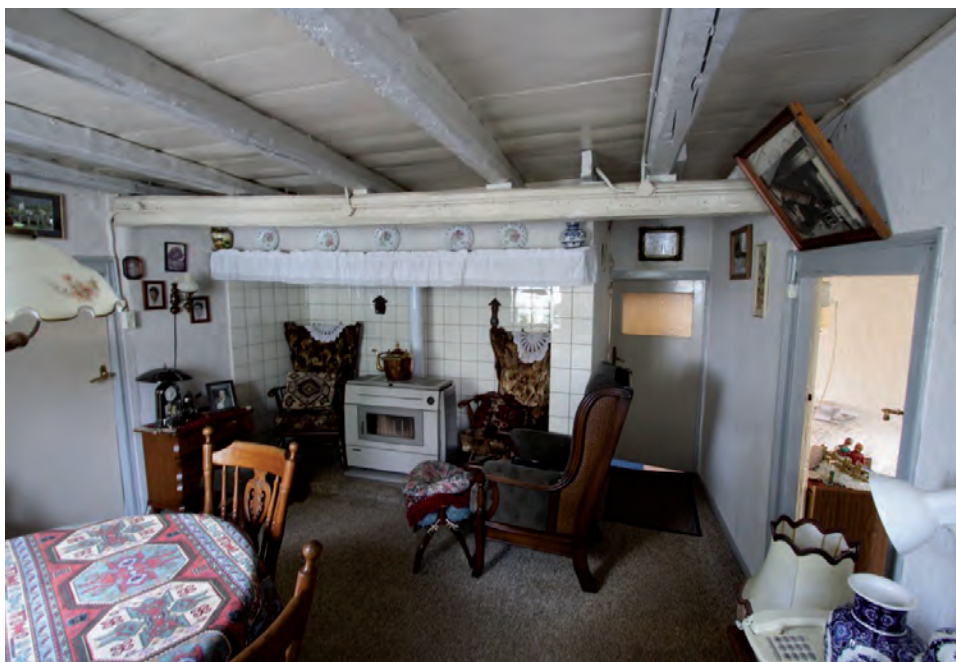
Afbeelding 10: De herd gezien in de richting van de brandmuur. Rechts van de schouw de deur naar het voormalige staldeel.