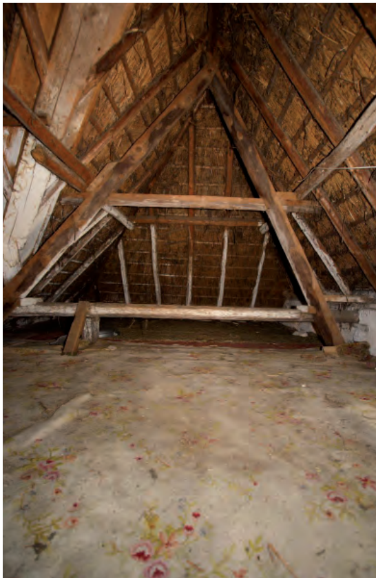
Afbeelding 16: De zolder boven de vergrote ouderslaapkamer.