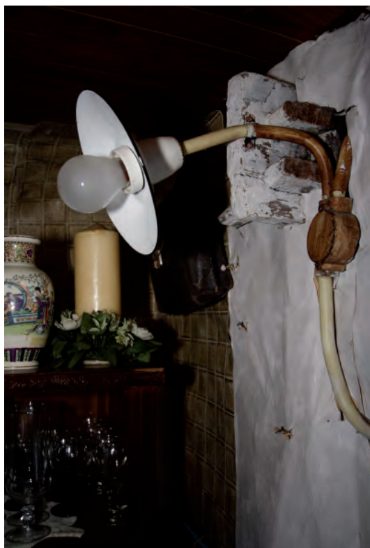
Afbeelding 11: In de linker zijbeuk is ter plaatse van het eerste gebint nog goed de negentiende-eeuwse gebintverankering te zien.