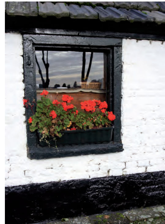
Afbeelding 06: Een afbeelding van een hergebruikt negentiende- of zelfs nog achttiende-eeuws venster in de rechter zijgevel. Dit venster had oorspronkelijk raamluiken en moet zijn geplaatst na de ophoging van de zijgevel (het venster sluit aan op de muurplaat).