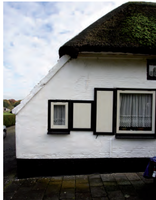
Afbeelding 04: De linkerhoek van de voorgevel. De pleisterlaag is een eerste indicatie dat de hoek gewijzigd is. Andere aanwijzingen is de rollaag die doorbroken wordt door het secundaire zolderraam en de opgehoogde zijgevel (zowel in het exterieur als in het interieur vast te stellen).