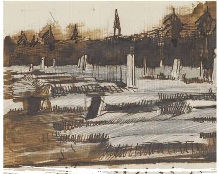
Vincent van Gogh, Schets in brief van Vincent van Gogh aan Theo van Gogh, Hoozevee, 16 september 1883, potlood, pen en inkt op papier, Van Gogh Museum, Amsterdam (Vincent van Gogh Stichting)

De waarden sluiten ook perfect aan bij het oorspronkelijke karakter van Drenthe. We gaan ze vertalen naar een merkverhaal, dat de basis vormt voor alle activiteiten. Dit wordt visueel vertaald naar een beeldmerk en huisstijl dat breed ingezet kan worden. De voorwaarden maar vooral mogelijkheden voor gebruik hiervan worden vastgelegd in een huisstijltoolkit. Het beeldmerk van Drenthe bestaat al uit het door Van Gogh geschreven woord Drenthe . Wellicht dat hier een combinatie mee te maken is.