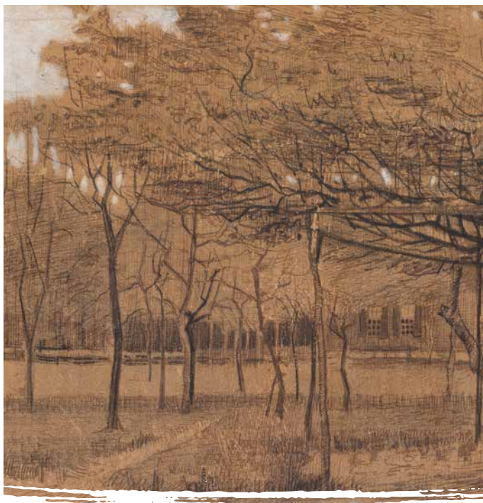
Vincent van Gogh, Boomgaard, 183, pen en bruine inkt over zwart krijt, met wit gehoogd op papier, Museum Boijmans van Beuningen, Rotterdam

We willen de culturele erfenis van Vincent van Gogh in Drenthe blijvend zichtbaar en beleefbaar maken voor de eigen inwoners en binnenlandse en buitenlandse bezoekers. Daarnaast willen we het bijzondere verhaal van Van Gogh gebruiken om de (huidige) waarden van Drenthe te benadrukken.