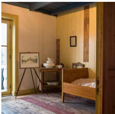
Slaapkamer van Van Gogh (reconstructie Van Gogh Huis), 2020

reason to travel naar Drenthe, maar zorgt het er ook voor dat Drenthe een nieuwe dagattractie rijker is voor de verblijfstoerist die al in Drenthe op vakantie is. Binnen de Nederlandse doelgroep cultuur-(historisch) geïnteresseerden is 50% bekend met het Van Gogh erfgoed in Drenthe (t.o.v. 33% in 2021) en Drenten dragen dit vol trots uit. Naast investeringen in aanbod zijn er ook integrale samenwerkingen met een duurzaam karakter tot stand gekomen op het gebied van cultuur, natuur, openbare ruimte, onderwijs en vrijetijdseconomie.