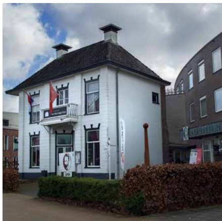
Van Goghstraat 1, Nieuw-Amsterdam/ Veenoord, 2020

Eind 2023 is er, dankzij een integrale aanpak, draagvlak gecreëerd om het verhaal van Van Gogh uit te (blijven) dragen. Diverse partijen hebben besloten blijvend te investeren in het behoud en eventueel verder doorontwikkelen van de erfgoedlocaties. Van Gogh in Drenthe is onderdeel geworden van gemeentelijk en provinciaal beleid en verschillende erfgoedlocaties hebben een monumentenstatus gekregen. Van Gogh maakt deel uit van de vaste collectie van het Drents Museum en het Van Gogh Huis heeft een upgrade gehad, zodat het ook na 2023 voldoende aantrekkingskracht houdt. Er zijn duurzame activiteiten en producten ontwikkeld die ook na 2023 zorgen voor het zichtbaar en beleefbaar maken van deze erfenis. Hiermee is Van Gogh niet alleen een