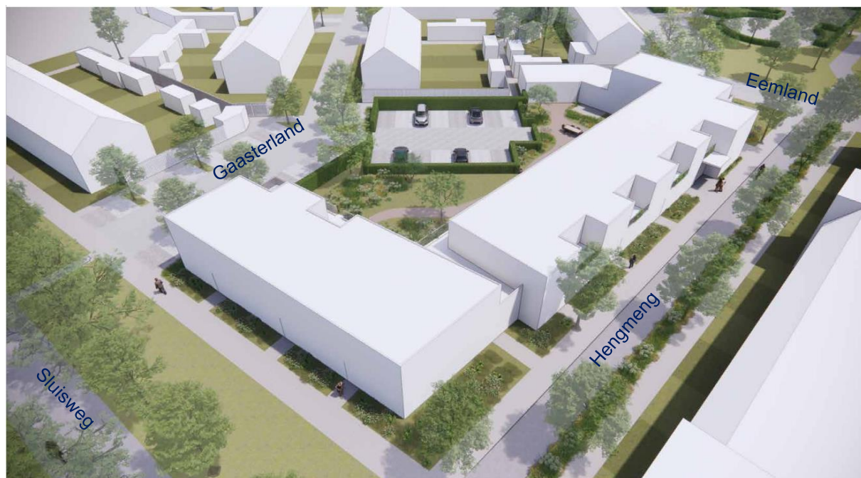
impresie van bovenaf vanuit de Sluisweg richting Eemland.