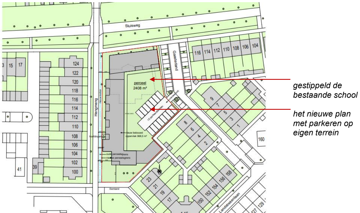
De nieuwe situatie met dun gestippeld nog het bestaande schoolgebouw

Enkele informatieve beelden van het ontwerp zijn hier onder weergegeven.