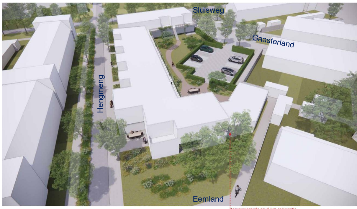
impresie van bovenaf vanuit Eemland richting Sluisweg.