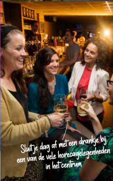
Sluit je dag af met een drankje bij een van de vele horecagelegenheden in het centrum

Langer verblijven in Bergen op Zoom om stad en streek verder te verkennen? Bergen op Zoom telt heel wat accommodaties zoals B&B's, hotels en campings. Kijk op vvrbrabantsewal.nl voor het aanbod.