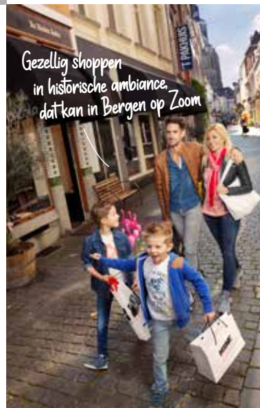
Gezellig shoppen in historische ambiance, dat kan in Bergen op Zoom

De winkels zijn extra geopend op vrijdagavond en elke laatste zondag van de maand. Je kunt dan gezellig shoppen en tijdens een aantal koopzondagen worden bovendien leuke activiteiten georganiseerd. De weekmarkt is op donderdag. Op loopafstand van het historische centrum liggen De Zeeland Leisure & Shopping en de Woonboulevard voor nog meer shopplezier!