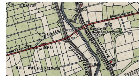
Kaart met tramlijn Kruisland - Oud-Gastel, 1895