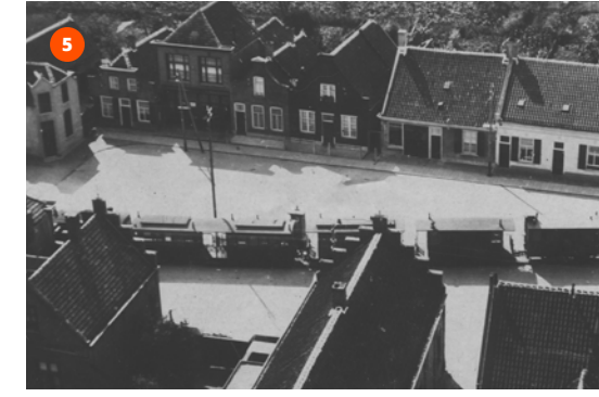
De tram rijdt over de Markt in Kruisland, 1922