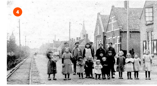
Molenstraat voor 1937