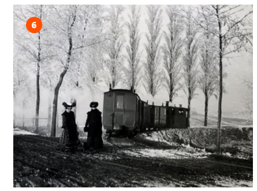
Stoomtram op Nieuwe Gastelsedijk nabij Veerkensweg, 1908

3 Kromme Hoek Via de Holderbergsestraat gaat het Ommetje Coupure over een stukje onverharde weg: de Kromme Hoek. Voordat in 1932 het Kadaster werd opgericht werd er een denkbeeldige inrichting gemaakt van de percelen. Dit gebiedje was de kromme hoek van zo'n perceel.