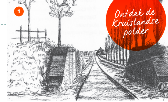
Tekening aanpassing dijkcoupure S. Janssens, omstreeks 1892