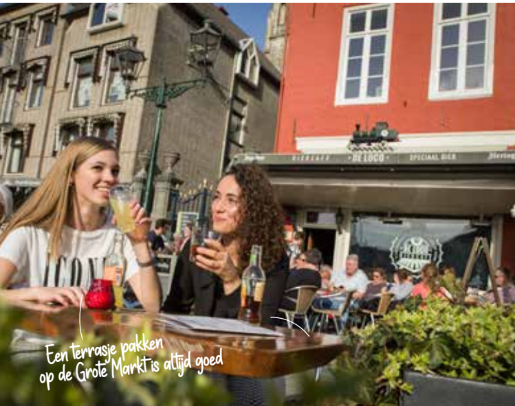
Een terrasje pakken op de Grote Markt is altijd goed

Om de weg gemakkelijk te vinden in deze veelzijdige stad vind je op de achterzijde een plattegrond met daarop een stadswandeling langs de monumenten, het winkelgebied en een overzicht van bezienswaardigheden in de omgeving.