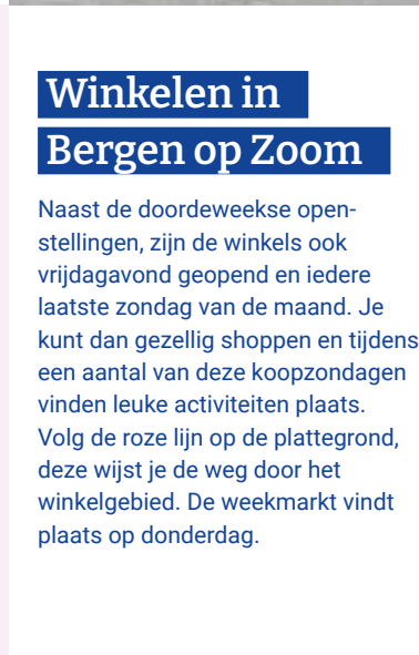
Gezellig shoppen in historische ambiance, dat kan in Bergen op Zoom

De stad kent een goed gevulde evenementenkalender. Historische en culturele evenementen zoals de Maria Ommegang en openluchtspektakels van De Vierschaar staan jaarlijks op het programma. Naast de terugkerende jaarmarkten, kermissen en muziekfeesten hebben events als de Krabbenfoor, ProefMei en JazzBoZ al jaren een vaste plaats op de agenda. Check vwwbrabantsewal.nl voor het complete overzicht!