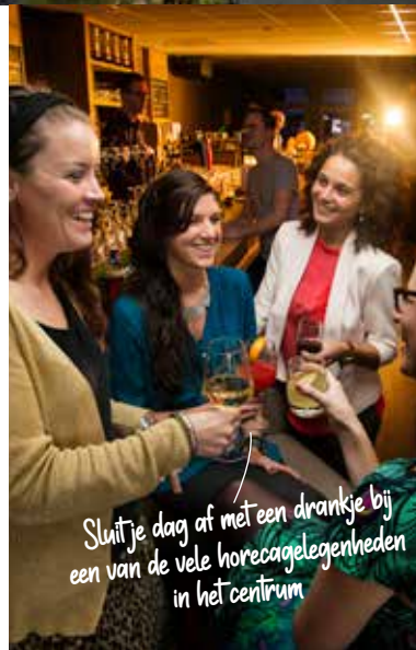
Sluit je dag af met een drankje bij een van de vele horecagelegenheden in het centrum