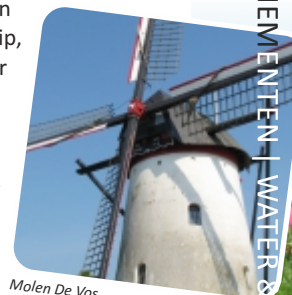
Molen De Vos

een halte met de naam Princeweg met een los- en laadspoor. De brede dijken in het landschap die je aantreft waren de 'tramdijken'. Het spoor liep hier over. Het is nu nog maar moeilijk voor te stellen dat hier 50 jaar lang stroomtrams langs boemelden! In Ouddorp is het museum van de stichting Rotterdamse Tramweg Maatschappij gevestigd. Hier kan je onder meer een rit maken in een originele stoom- of dieseltram. Meer informatie vind je via www.rtm-ouddorp.nl .