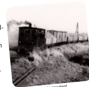
Stoomtram nabij Notendaal

Op deze oude Bloemdijk (6) uit de tweede helft van de veertiende eeuw liep vroeger een klinkerweg naar Bergen op Zoom. Staatsbosbeheer heeft de dijk de bestemming bloemdijk gegeven. Door na het maaien het gras af te voeren ontstaat er voedselarme grond. Hierdoor tref je een grote diversiteit aan prachtige bloemen aan. De dijk wordt extensief gemaaid, zodat het gras vooral in de zomer behoorlijk hoog kan staan. Nadat er gemaaid is, is de aanwezigheid van bloemen uiteraard minimaal. Het is toegestaan om op de kruin van de dijk te lopen. Houd wel één pad aan, zodat ook de mensen na je nog kunnen genieten van het lopen door de bloemenpracht.