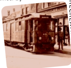
Dieseltram bij halte Nieuw-Vossemeer

Jong wordt bewaard. Voor het museum staat het beeldje van Merijntje Gijzen, bekend van de streekroman van A.M. de Jong en de televisieserie. In het museum is ook een permanente tentoonstelling over de Watersnoodramp ingericht. Je kunt er zien hoe ontzettend hoog het water in 1953 is gekomen.