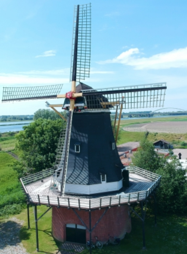
Molen De Assumburg

MONUMENTEN | NATUUR | EVENEMENTEN | WATER & RECREATIE