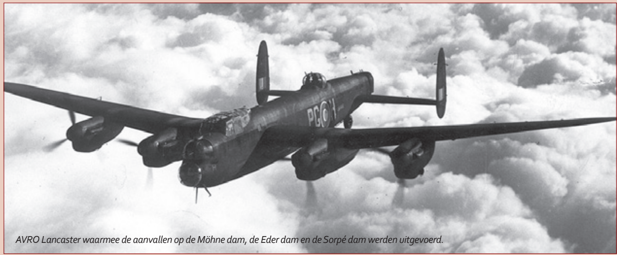
AVRO Lancaster waarmee de aanvallen op de Möhne dam, de Eder dam en de Sorpé dam werden uitgevoerd.

5. Locatie neergestorte gevechtsvliegtuig Indien u geïnteresseerd bent kunt u eventueel ook de plaats bezoeken waar Guy Gibson en James Warwick in hun De Havilland Mosquito zijn neergestort. Deze locatie ligt iets buiten het centrum op circa 15 minuten loopafstand van