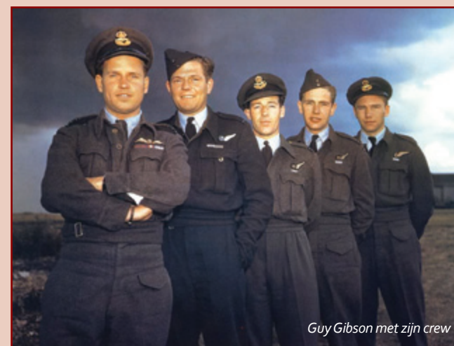
Guy Gibson met zijn crew

Op 19 september 1944 bestuurde Guy Gibson als masterbomber een tweemotorige bommenwerper van het 627 squadron met als navigator squadronleader James Warwick. Deze jachtbommenwerper (type De Havilland Mosquito) was een voor die tijd zeer geavanceerd type vliegtuig dat met hoge snelheden (bijna 700 km per uur) op lage hoogte kon vliegen. In dit tweepersoonsvliegtuig zat de piloot en de navigator naast elkaar. Op die bewuste septemberdag kwamen zij terug van een bombardement op Rheydt en Münchengladbach. Omstreeks 22.45 uur werd de jachtbommenwerper met een haperende motor gezien boven Steenbergen. Het werd veroorzaakt door een technisch defect waardoor het vliegtuig zonder brandstof kwam te zitten, waarna deze vlakbij een boerderij in de toenmalige West Graaf Hendrikpolder neerstortte en in brand vloog. De beide inzittenden werden nabij het wrakstuk gevonden en werden op het plaatselijke Rooms-Katholieke kerkhof van Steenbergen begraven.