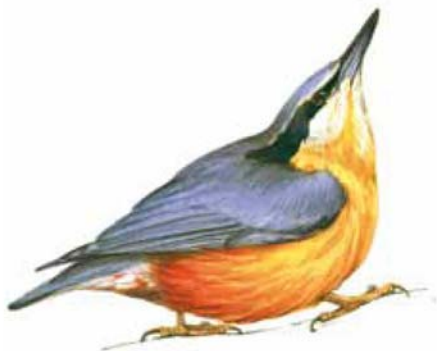
De boomklever is een van de vele zangvogels in het Moretusbos.

Overweldigd door de cultuurhistorie van het bos zou u haast vergeten dat u zich in een natuurgebied bevindt. Ook al is het Moretusbos door mensenhanden aangelegd, de natuur krijgt er ruimschoots de kans. Zo staan er tal van bomen die op zichzelf monumenten zijn. Van de beuken, eiken, grove dennen en kastanjabomen hebben waarschijnlijk enkelen de tijd van jonker Moretus ´in levende lijve´ meegemaakt. Wat dichterbij de grond vallen vooral de vele rododendronstruiken op. Deze stammen niet uit de tijd van de jonker, maar zijn halverwege de negentiende eeuw aangeplant. Deze rododendron, die vooral langs de paden groeit, geeft de wandelaar een beschermt gevoel. Waar men vroeger in het zicht van iedereen flaneerde, lenen de paden zich nu prima voor een romantische wandeling. Ook allerlei diersoorten voelen zich thuis op het landgoed van de jonker. Eekhoortjes verplaatsen zich behendig in het bladerdak. Reeën houden zich meestal goed verstopt. Als u goed luistert, hoort u het zachte tikken van de vele sprinkhaantjes die zich in het struikgewas verscholen houden. Het Moretusbos telt ook een groot aantal soorten vogels, waaronder verschillende spechten, boomklevers, gaaien, uilen en vele andere broedvogels. Vanuit de lucht wordt u in de gaten gehouden door de roofvogels die het landgoed van de jonker lijken te bewaken. Cultuur en natuur gaan hier hand in hand.