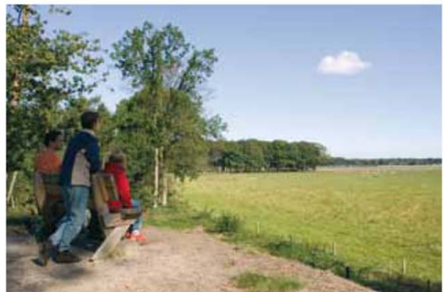
Uitzicht vanaf de Geldberg.

Andere bezienswaardigheden zijn de Geldberg met zijn uitzicht, het Fort, de Huzarenberg en het Sterrenbos. Elk met een eigen verhaal en geschiedenis. U kunt deze lezen op de informatiepanelen langs de wandelroute.