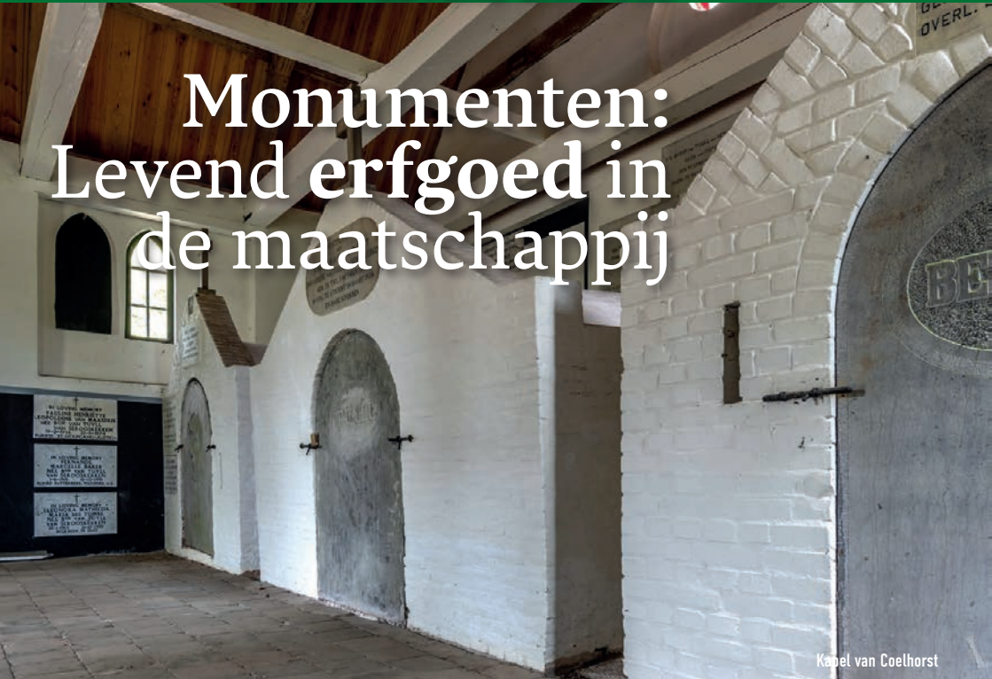
Kapel van Coelhorst

L evend erfgoed bij monumenten kun je ook zien in sociaal opzicht: mensen die zich samen inzetten voor ons erfgoed.