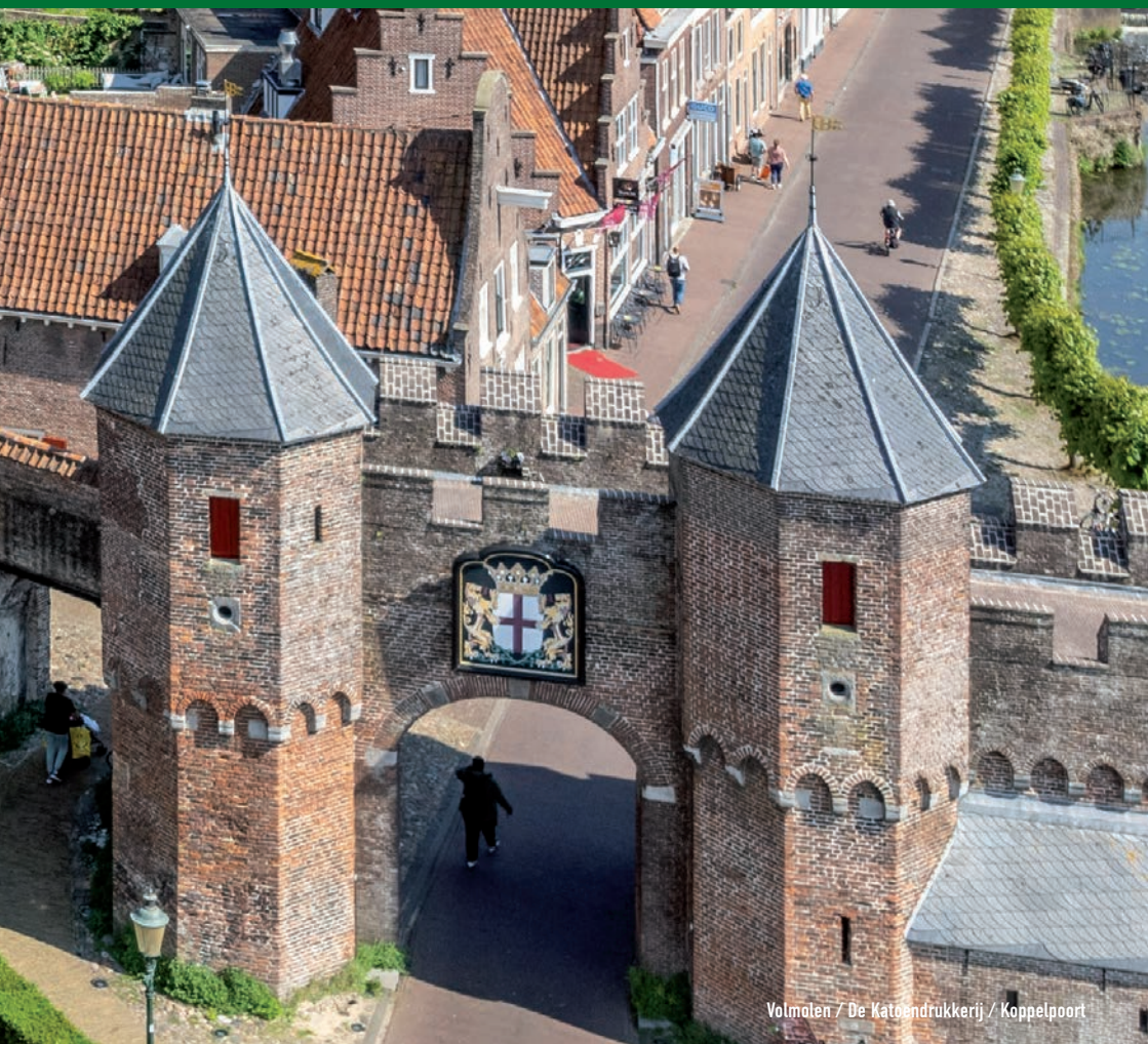
Volmolen / De Katoendrukkerij / Koppelpoort

L evend erfgoed is ook verweven met de identiteit van een stad of regio. Historische gebouwen, zoals kerken, kloosters en industriële complexen, kunnen een magneet vormen voor toeristen en creatieve bedrijven. Het behoud van oorspronkelijke materialen en bouwstijlen draagt bij aan de authenticiteit en het karakter van de omgeving, waardoor de geschiedenis van de plek zichtbaar blijft.